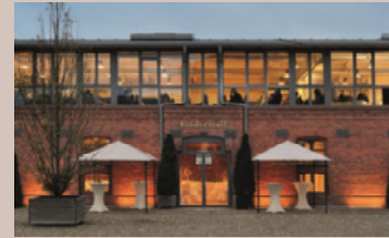
Rinderstall - Salon Ernst, 1.OG

Raumhöhe: 2,7 - 4,4 m - Raumgröße: 40,4 x 12,5 m/505 m 2 Seeblick, Verdunkelung, barrierefrei