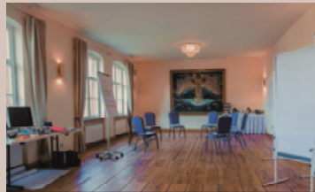
Gutsverwalter - Salon Anna, 1.OG

Raumhöhe: 3,7 m - Raumgröße: 4,5 x 15,4 m/78 m 2 Ein Nebenraum mit 13 m 2 , Verdunkelung, barrierefrei