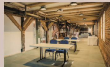
Kornspeicher - Salon Annelise, 1.OG

Raumhöhe: 2,8 m - Raumgröße: 4,2 x 9,8m/42 m 2 Seeblick, partiell Verdunkelung, historische Altinstallationen