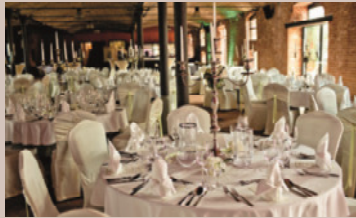
Rinderstall - Salon August, EG

Die berühmten Eisenbahnen Borsigs stehen für Innovation und Mobilität . Das frühere landwirtschaftliche Mustergut steht seit 1866 für Erfindungs- und Fortschrittsgeist . Deshalb ist das Landgut Stober wie geschaffen, um in stilvollem Ambiente denkmalgeschützter Gebäude, Ihre Tagungen, Seminare oder Feiern abzuhalten. Unsere 120 Jahre alte Druckwerkstatt oder die 80 Jahre alte Borsig-Dampfmaschine sind unter anderem buchbare Bestandteile unseres einmaligen Rahmenprogrammes.