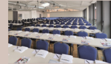
Rinderstall - Salon Conrad, 1.OG

Raumhöhe: 2,7 - 4,4 m - Raumgröße: 13,3 x 12,5 m/167 m 2 Seeblick, Verdunkelung, barrierefrei