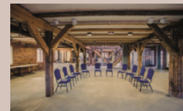
Kornspeicher - Salon Ruth, 1.OG

Raumhöhe: 2,8 m - Raumgröße: 4,2 x 9,8 m/42 m 2 Seeblick, partiell Verdunkelung, historische Altinstallationen