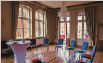
Gutsverwalter - Salon Albert, Hochpaterre

Raumhöhe: 2,7 - 4,4 m - Raumgröße: 14,2 x 12,5 m/178 m 2 Seeblick, Verdunkelung, barrierefrei