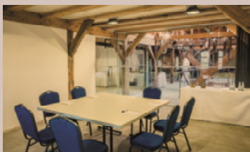
Kornspeicher - Salon Margret, 1.OG

Raumhöhe: 3,4 m - Raumgröße: 7,20 x 17,40m/125 m 2 Seeblick, keine Verdunkelung, barrierefrei