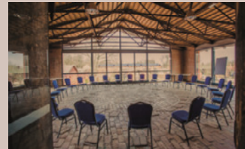
Brennerei - Panorama, 1.OG

Raumhöhe: 3,1 m - Raumgröße: 10,8 x 5,3 m/58 m 2 Nebenraum mit 13 m 2 , Verdunkelung, barrierefrei