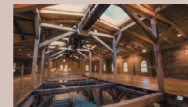
Kornspeicher - Kreativgalerie, 2.OG

Raumhöhe: 2,8 m - Raumgröße: 9,3 x 13,2 m/122 m 2 Partiell Verdunkelung, historische Altinstallationen