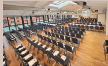
Rinderstall - Salon Conrad, Arnold und Ernst, 1.OG

Raumhöhe: 3,1 m - Raumgröße: 42 x 14 m/597 m 2 Befahrbar mit PKW, keine Verdunkelung, barrierefrei