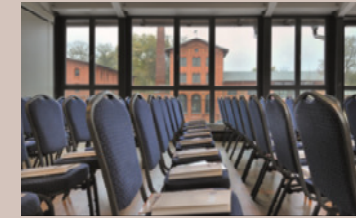
Rinderstall - Salon Arnold, 1.OG

Raumhöhe: 2,7 - 4,4 m - Raumgröße: 12,2 x 12,5 m/154 m 2 Seeblick, Verdunkelung, barrierefrei