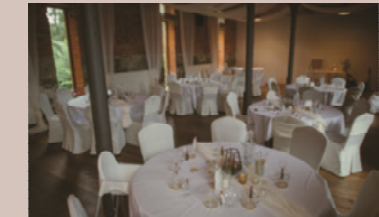
Kälberstall - Salon Luise, EG

Raumhöhe: 3,3 m - Raumgröße: 7,7 x 6,1 m/44 m 2 Seeblick, Blick auf die Dampfmaschine, keine Verdunkelung